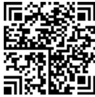
图 C.3 汉信码的物流追溯单元的追溯二维码