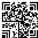
图 C.9 汉信码的货物装运追溯的追溯二维码

采用汉信码编码,纠错等级设置为 L2(15%),得到该货物装运追溯的追溯二维码见图 C.9。