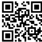
图 C.20 快速响应矩阵码的位置追溯单元的追溯二维码示例

采用 GS1 快速响应矩阵码,纠错等级均设置为 L 级(7%),得到该位置追溯单元的追溯二维码符号见图 C.20。