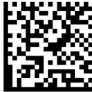
图 C.19 数据矩阵码的位置追溯单元的追溯二维码示例

采用 GS1 快速响应矩阵码,纠错等级均设置为 L 级(7%),得到该位置追溯单元的追溯二维码符号见图 C.20。