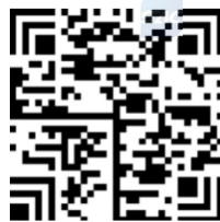
图 C.15 汉信码的单个资产追溯单元的追溯二维码

采用汉信码编码，纠错等级设置为 L2(15%)，得到该单个资产追溯单元的追溯二维码见图 C.15。