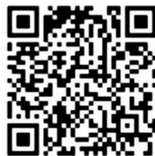
图 C.2 快速响应矩阵码的物流追溯单元的追溯二维码示例

采用 GS1 快速响应矩阵码，纠错等级均设置为 L 级(7%)，得到该物流追溯单元的追溯二维码符号见图 C.2。